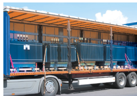
Zertifizierte Speditionen und LKWs mit Spezialaufbauten und -sicherungen

Den hohen Eigenanspruch, den wir an unser verantwortungsvolles Handeln haben, unterstreichen Auszeichnungen und Zertifikate.